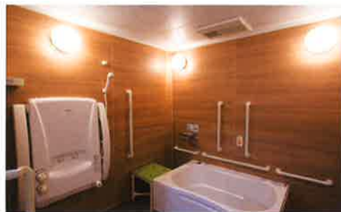
ミストサウナ付の浴室

共同生活室のダイニングスペース。美味しさはもちろん、いつも温かい食事を楽しんでいただけるよう、ユニットごとにできたてのごはんとお味噌汁を手づくりしご提供します。