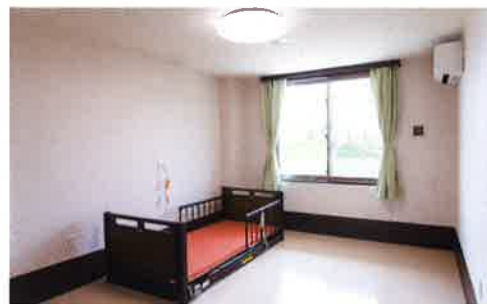
「低床型ベッド」タイプの居室

全室個室で、1ユニットの定員は10人。1階は2ユニット、 2・3階は同じレイアウトで、4ユニットになります。