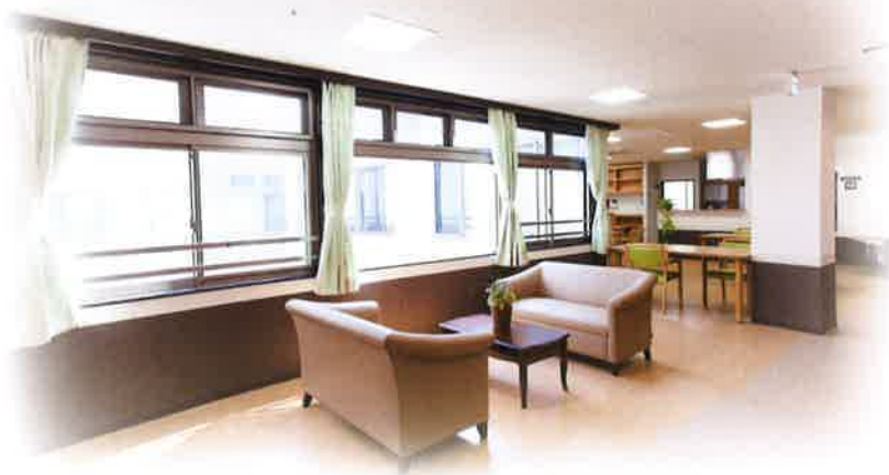
3F 共同生活室 ソファスペース

明るい陽光に包まれた空間の中、 一人ひとりに寄り添うサービス。 自然と心が通い合う、 生き生きと充実した一日一日を お送りいただけるようお手伝いいたします。