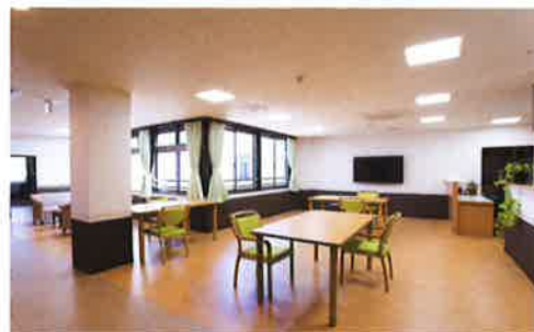
共同生活室のダイニングスペース

プライベートを重視した居室は、お持ち込みの家具にもマッチするように、清潔感あふれるシンプルな色調で統一。またベッドからの転落を予防する、安全性にすぐれた「低床型ベッド」タイプもございます。