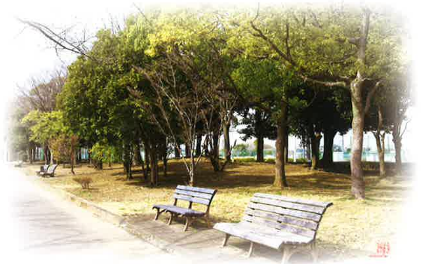
隣接するしらこぼと運動公園

桜が舞う春。緑がキラキラと輝く夏。 鮮やかな紅葉に燃える秋。 澄んだ夜空に星が瞬く冬。 しらこぼと運動公園の四季の移ろいも、 彩り豊かな暮らしに欠かせない魅力です。